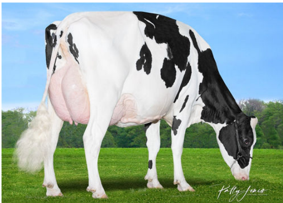
MORNINGVIEW DUKE ZIP GRANDDAM