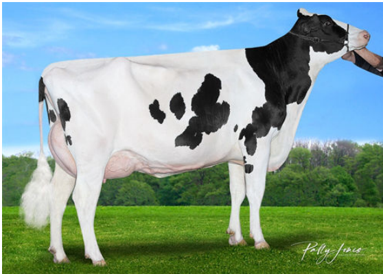
CLAYNOOK ZEETA PURSUIT DAM